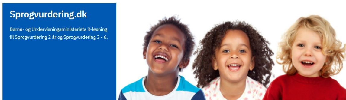
Billedet viser forsiden af Sprogvurdering.dk

Demoversionen ligger nederst på denne side: www.sprogvurdering.dk