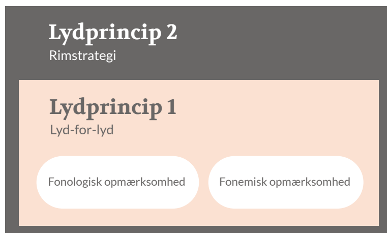
Figur 1. Grundlæggende stave- og afkodningsstrategier