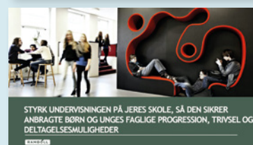
Præsentationer til forvaltning og skole