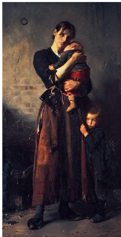
Frants Henningsen: "Forladt. Dog ej af venner i Nøden" (1888).