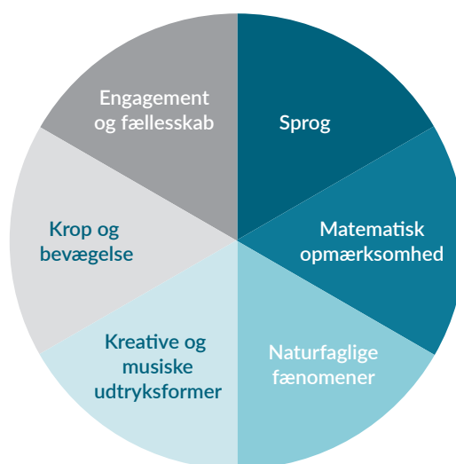
Figur 1: Børnehaveklassens seks kompetenceområder