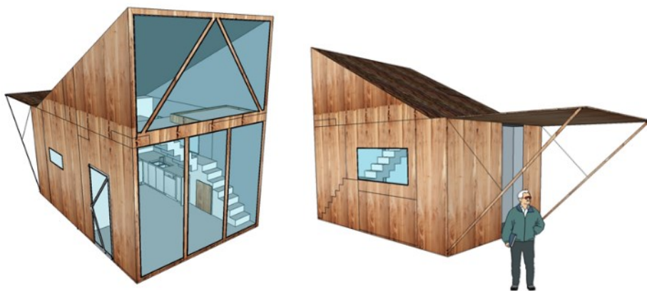
Tiny House 25 m2 (elev)

Forløbet om Tiny House bygger på et samspil mellem designprocessen og genstandsfeltet arkitektur. I forhold til læreplanen for Design og Arkitektur på både C- og B-niveau kan man få dækket genstandsfeltet arkitektur bredt, designteori med punktnedslag i arkitekturhistorien og designprocessens elementer, visualiserings- og researchmetoder samt relevante designparametre, der supplerer og nuancerer fagets overordnede parametre (form, funktion og kommunikation) med bl.a. økologi og miljø, økonomi og samfund, materiale, teknologi og målgrupper.